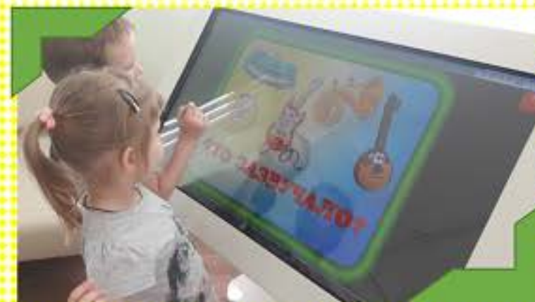
Развиваем фонематический слух.