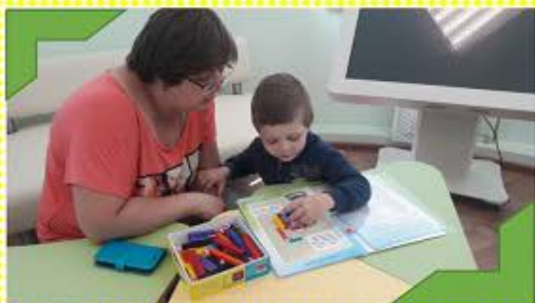
Формируем пространственные представления