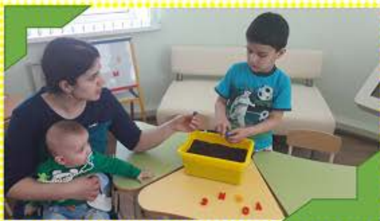
Закрепляем названия букв