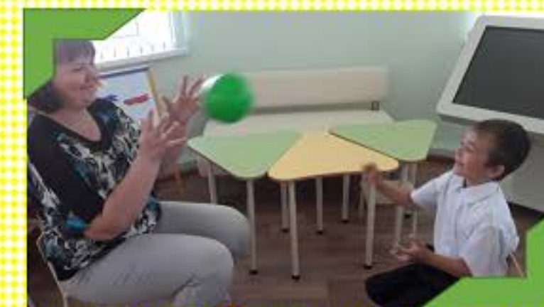
Формируем умение согласовывать существительное с числительным