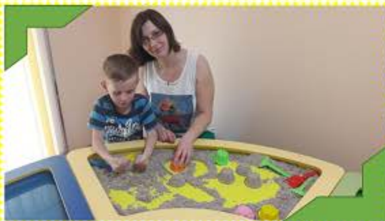
Закрепляем применение предлогов в, из, под