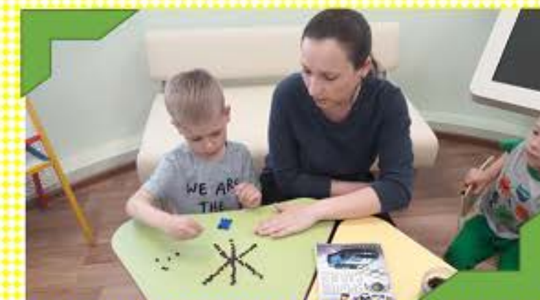
Закрепляем образ буквы