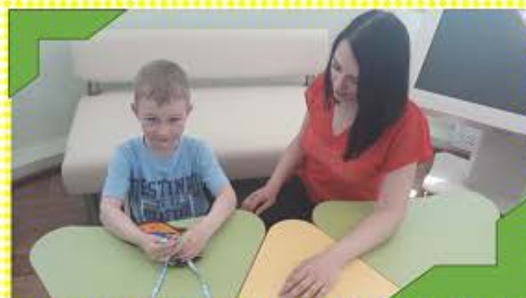
Совершенствуем моторику рук