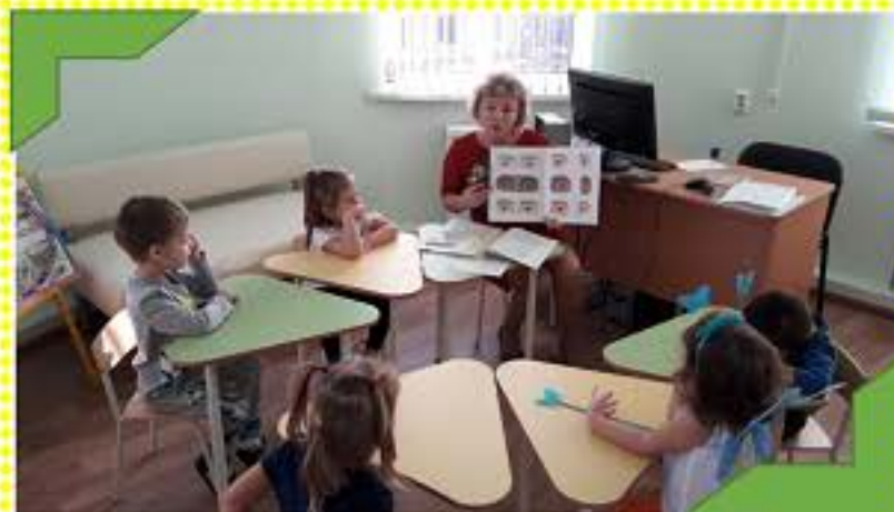
Формируем лексико-грамматические категории языка