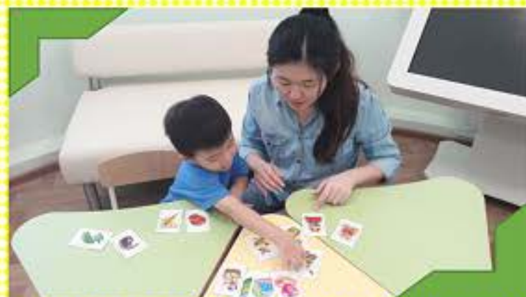
Закрепляем умение обобщать и классифицировать