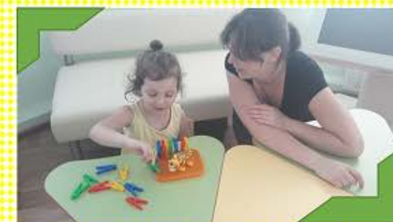
Развиваем логическое мышление