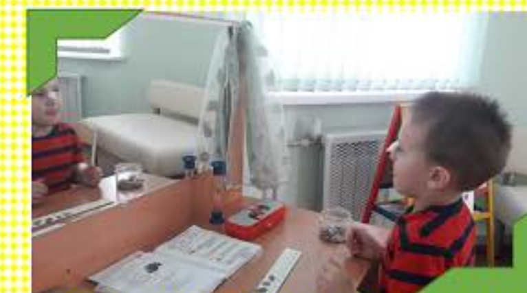
Готовим артикуляционный аппарат к постановке звуков