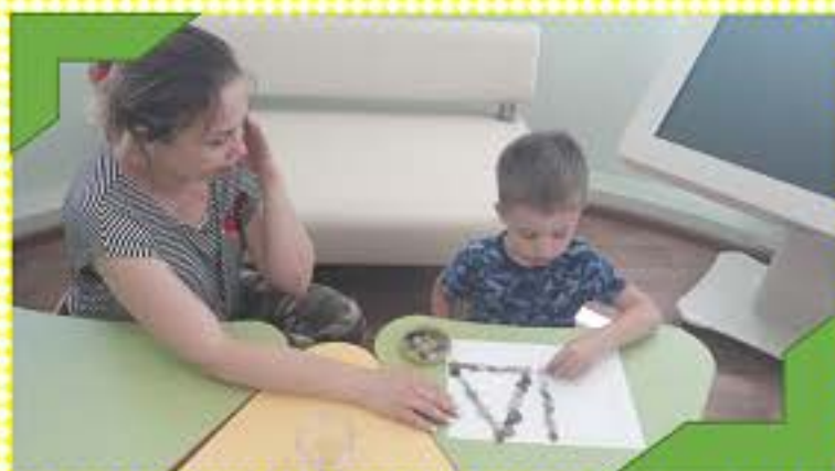
Закрепляем тему «геометрические фигуры»