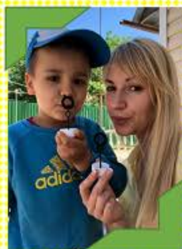
Формируем направленную воздушную струю